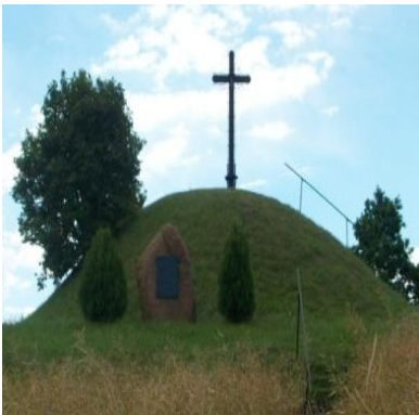
Cmentarz wojenny - mogiła z czasów I wojny światowej 1914-1918