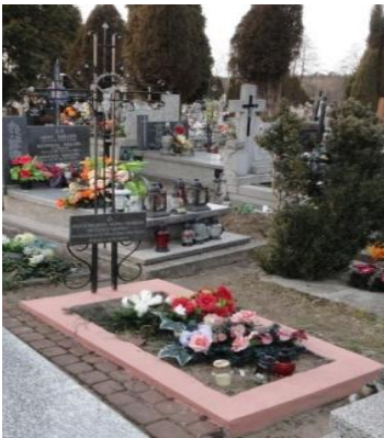
W grobie ziemnym zostali pochowani dwaj żołnierze Wojska Polskiego o nieznanym nazwiskach polegli w Niedrzwicy Dużej w dniu 16.09.1939r.