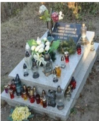
Żołnierze polegli w I wojnie 1914-1915r. których zidentyfikowano. Pierwotne metalowe tabliczki odręcznymi napisami mówiły o różnych narodowościach. Organizacja kombatancka położyła płytę i zmieniła napis.