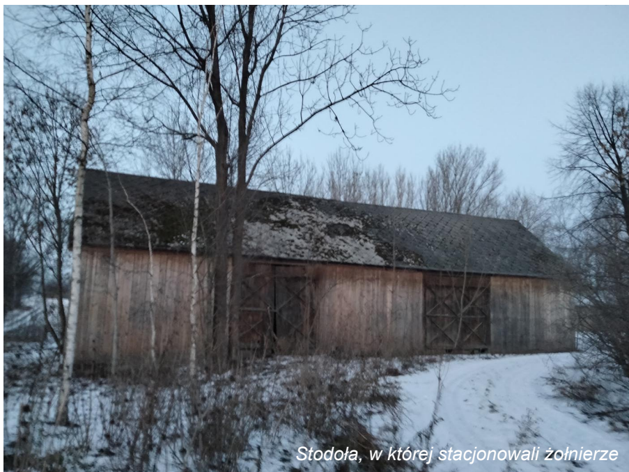
Stodoła, w której stacjonowali żołnierze