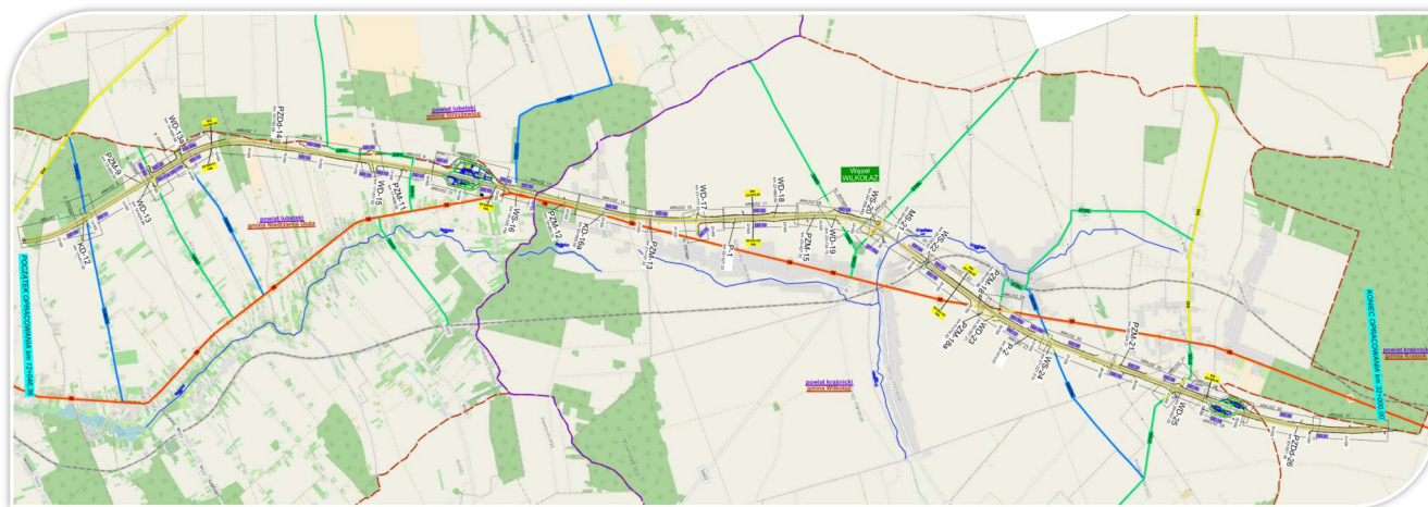
Schemat przebiegu projektowanego odcinka S19

Droga ekspresowa S19 stanowi element europejskiej międzynarodowej trasy relacji „północ-południe”. Korytarz transportowy drogi Via Carpatia prowadzi wzdłuż granicy wschodniej UE i ma połączyć tereny 7 krajów: Litwy, Polski, Słowacji, Węgier, Rumunii, Bułgarii i Grecji. Odcinek drogowy tego korytarza przez terytorium Polski będzie przebiegał z Budziska (granica z Litwą) przez Białystok, Lublin, Rzeszów do przejścia granicznego w Barwinku.